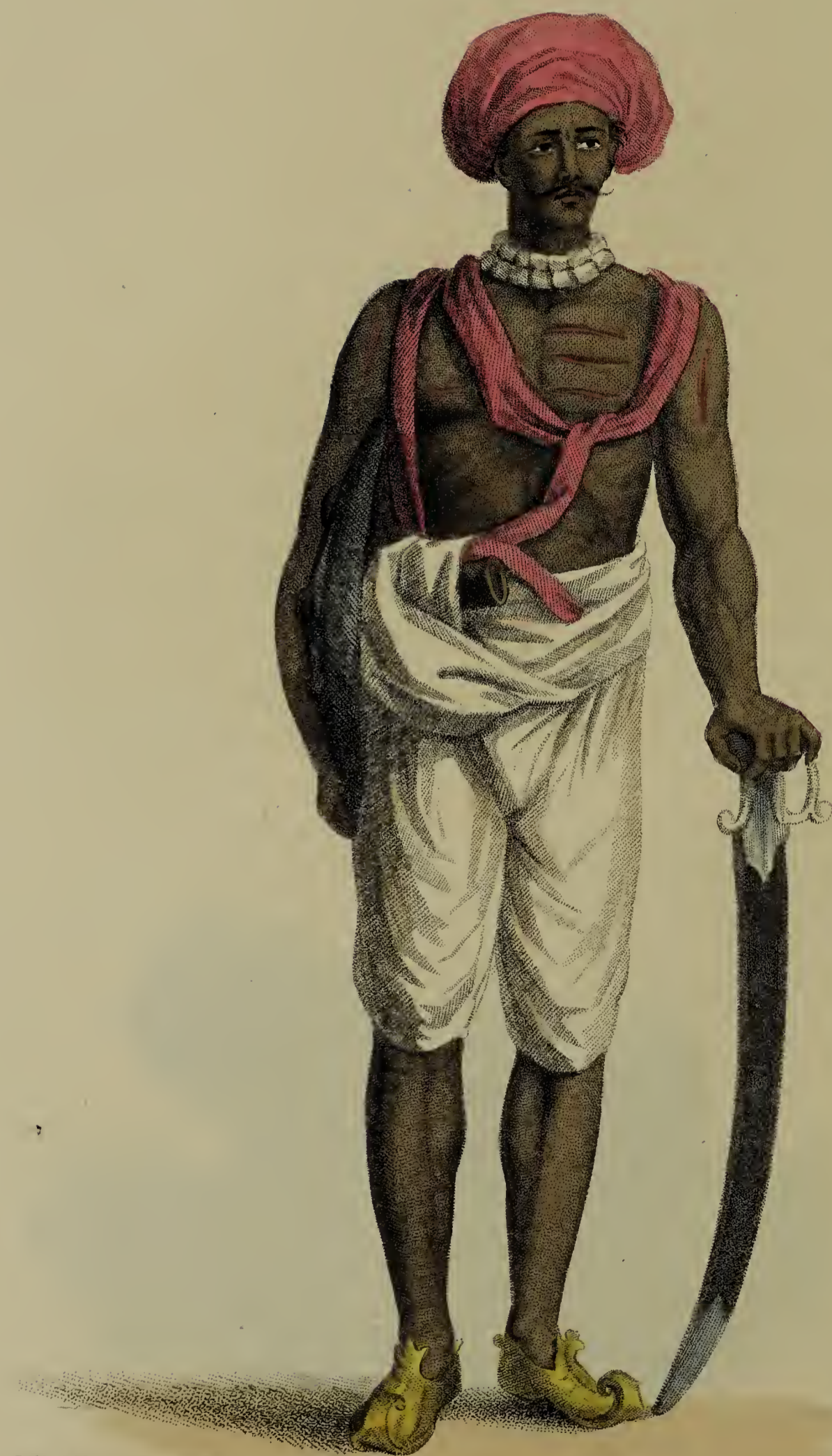
Bal! Solvyns pūr Calcutta.